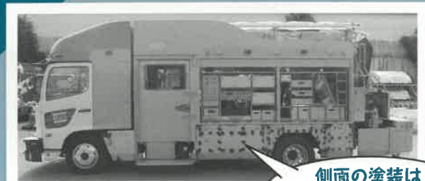
側面の塗装はオリジナルデザイン!